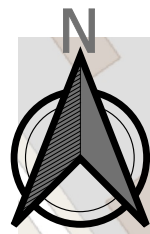
Схема інженерної підготовки, благоустрою території та вертикального планування М 1:1000